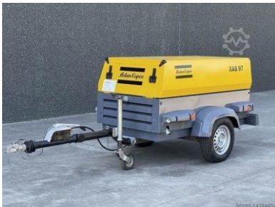
Atlas Copco 97 DD, 5,3 m 3