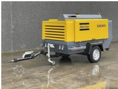
Atlas Copco 186 DD, 10,5 m 3