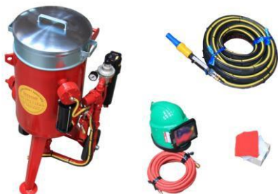
Sandstrahlkessel 100 oder 60 Liter inkl. Luftschlauch, Helm & 20 m Strahlenschlauch mit Düse